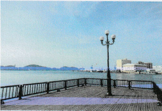
(ベルニー公園より)